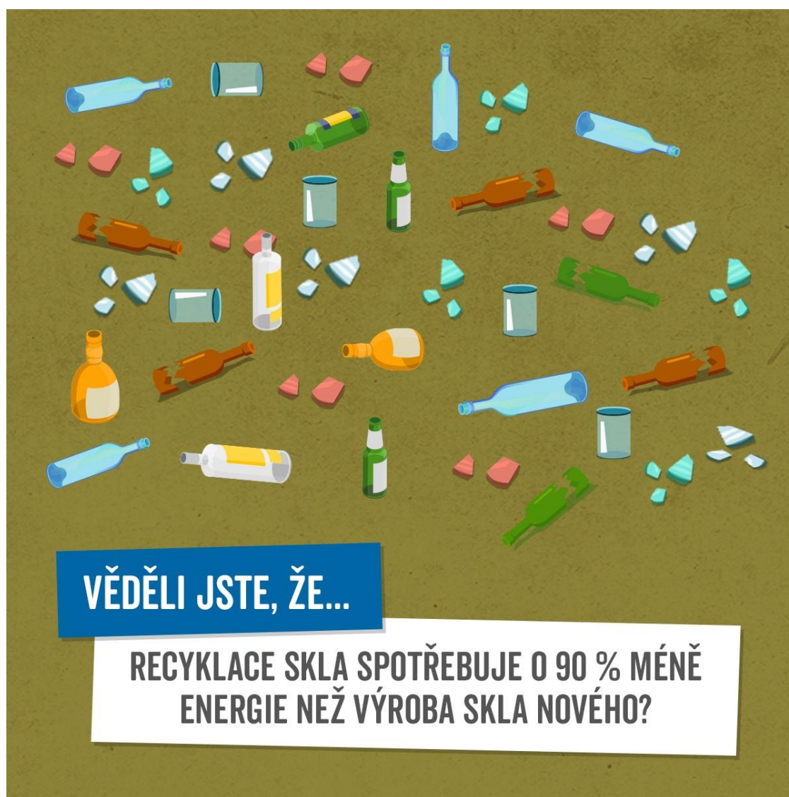
Obr. - Energie, která se spotřebuje na výrobu skla