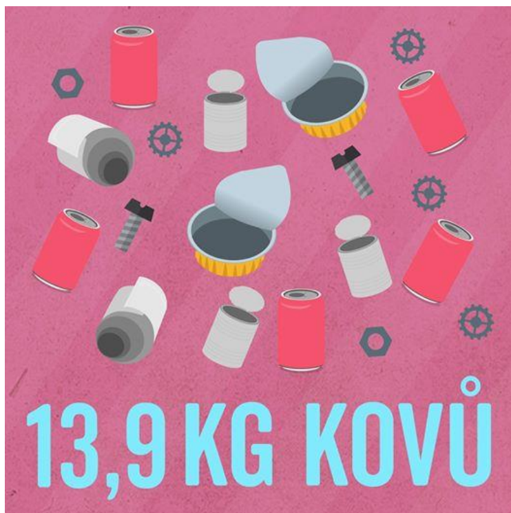
Obr. - V průměru každý občan ČR vytřídí téměř 14 kg kovů